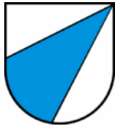
Beinwil am See